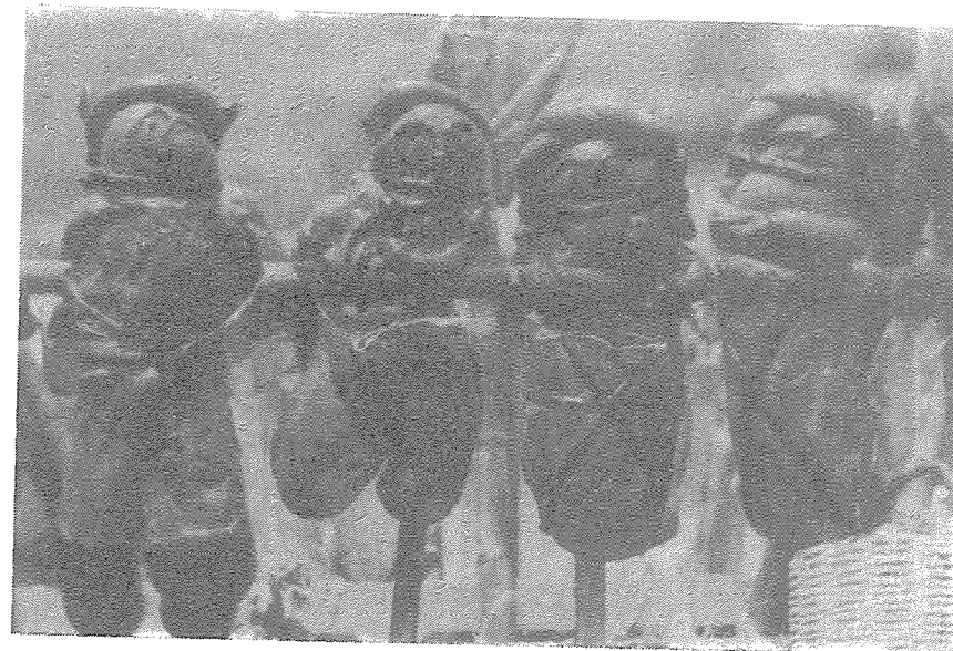
Las guaguas de pan en San Pedro