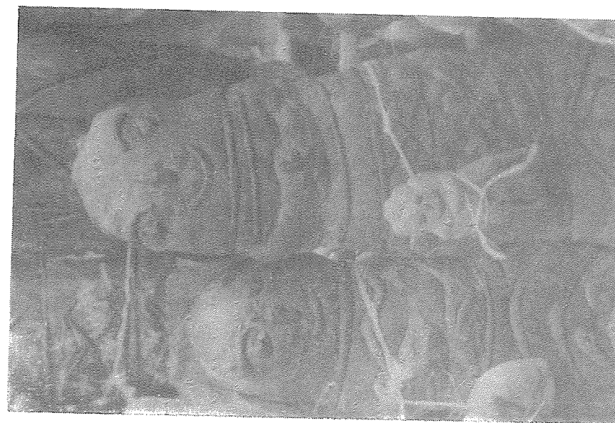
Las guaguas de pan en San Pedro